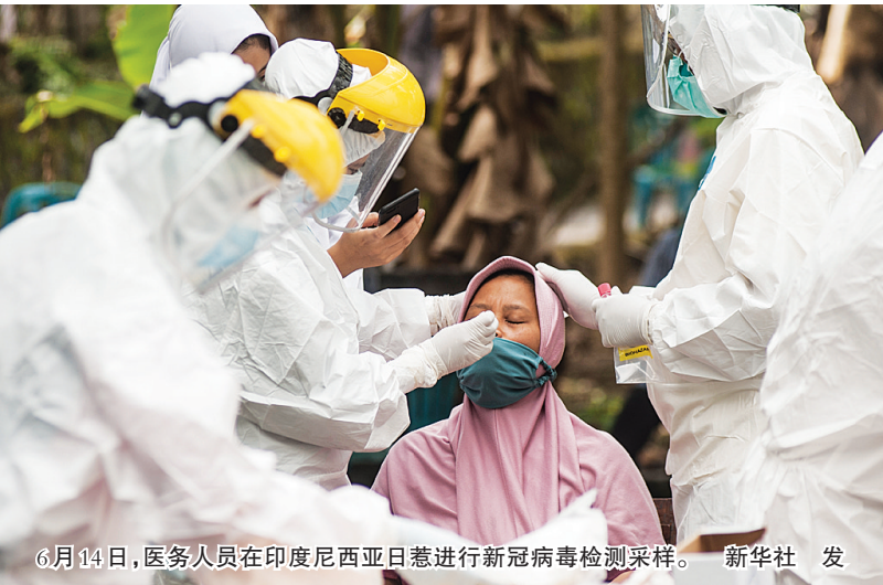
6月14日,医务人员在印度尼西亚日惹进行新冠病毒检测采样。

世界卫生组织13日公布的最新数据显示,全球累计新冠确诊病例达175306598例。世卫组织网站最新数据显示,截至欧洲中部时间13日15时01分(北京时间21时01分),全球确诊病例较前一日增加387209例,达到175306598例;死亡病例增加10158例,达到3792777例。 据新华社电