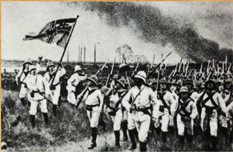
百年前 陆上国门破碎，海上门户洞开

《人民日报》近日发布一组中国百年前后对比照片，在互联网刷屏。百年前的中国任人宰割，今天我们坚决捍卫国家主权和民族尊严；百年前的中国发展严重滞后，今天我们用几十年时间走完了发达国家几百年走过的工业化历程……中国100年前后发生了什么？中国早已不是100年前的那个中国，中国的明天会更好。