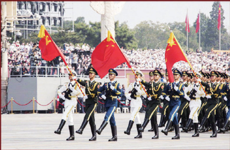
今天 我们有信心、有能力打败一切来犯之敌