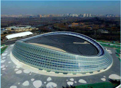
国家速滑馆“冰丝带”。