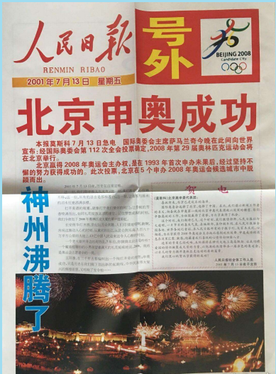
北京申奥成功人民日报号外。