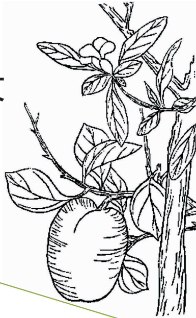
宣木瓜 (选自《植物名实图考》一八四八年出版)