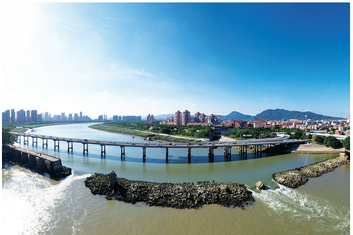
这是泉州南洋桥遗址(无人机照片,7月7日摄)。