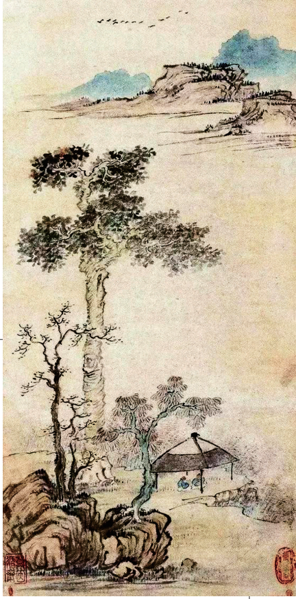
下凉亭,二人消暑,惬意自在。 元代倪瓒作。大雁高山,树下凉亭。