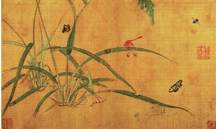
《嘉禾草虫图》(宋 吴炳)