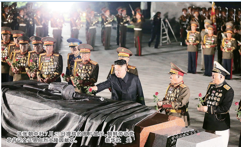
这张朝中社7月27日提供的图片显示,朝鲜劳动党总书记金正恩向烈士陵园献花。