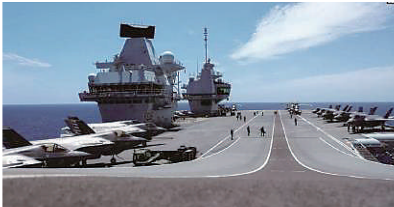
前往亚太途中的“伊丽莎白女王”号航母，18架舰载机中有10架是美军的

虽然英国政府此前对于此次花费不菲的远航颇为高调，但真到了南海，昔日纵横四海的英国海军先“怂了”——没有美国期待的“勇往直前”，只有对东盟诸国