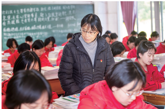
张桂梅(中)在教室里检查学生上课情况(2020年12月1日摄)。