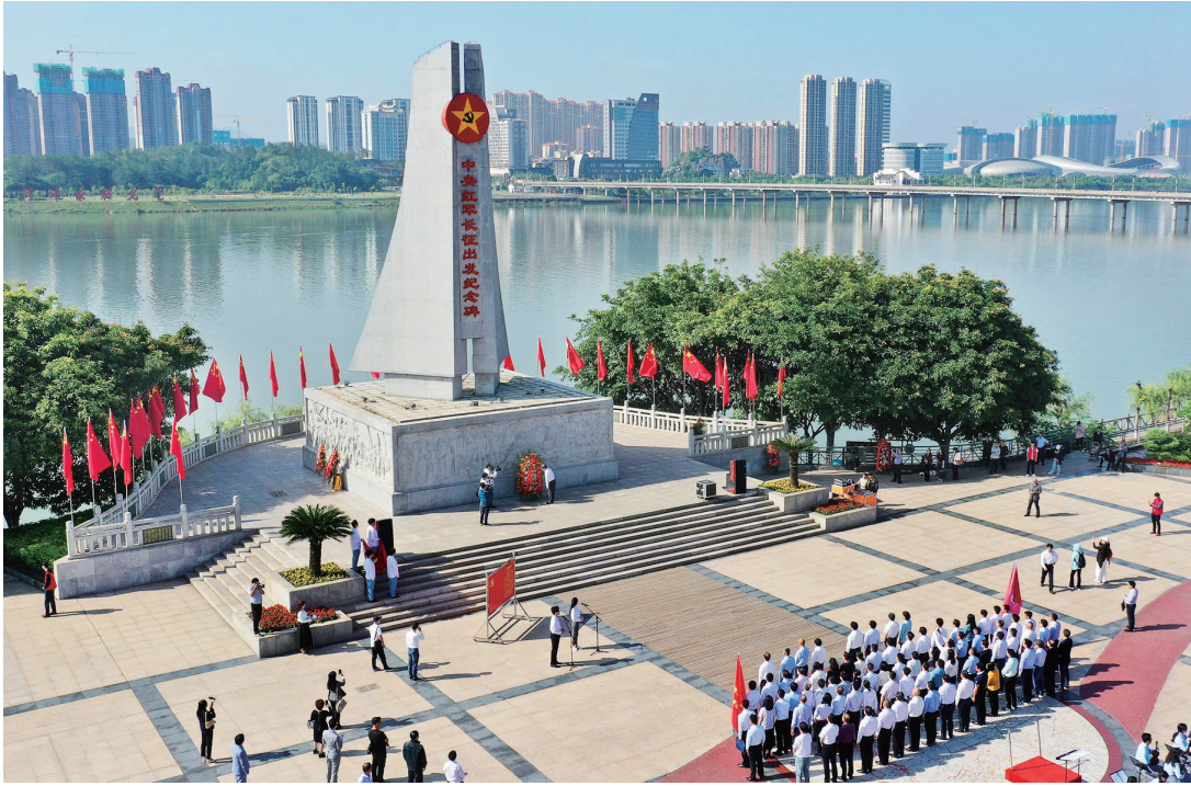
人们在江西省于都县中央红军长征出发纪念碑前参加纪念活动(4月30日摄,无人机照片)。