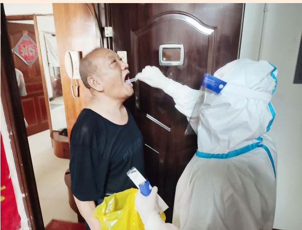
社区工作人员和防疫人员上门为居民做核酸取样检测。