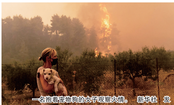
一名抱着宠物狗的女子观察火情。新华社发