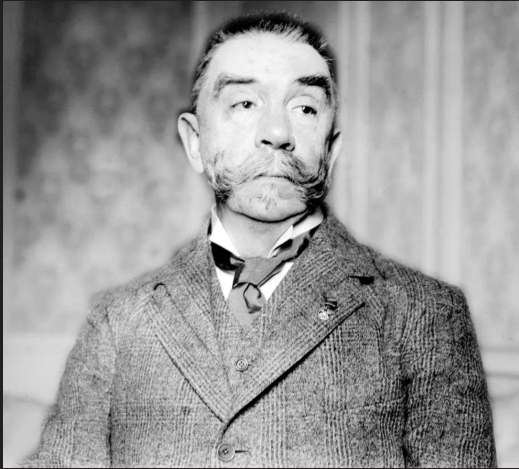
美国艺术家华特·威南斯,他靠下图这尊雕塑拿到了一块金牌。除此之外,他还参加射击比赛,两届奥运会斩获一金一银,堪称文武双全。