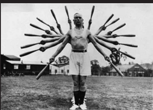
这一充满美感的运动据说是艺术体操的前身。