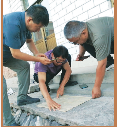
图为藏家们在朱辉旧居前研读刊登有朱辉英雄事迹的1946年9月19日《人民日报》。