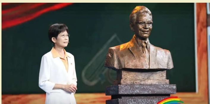
彭士禄的女儿彭洁在讲述父亲的故事。

被称为中国核动力事业“拓荒牛”的彭士禄作为中国核潜艇的第一任总设计师,他和同事们的奋斗捍卫了国家安全,在深海之中牢牢竖起了一道“核盾牌”。因为保密需要,在很长的时间里,他的名字都鲜为人知。