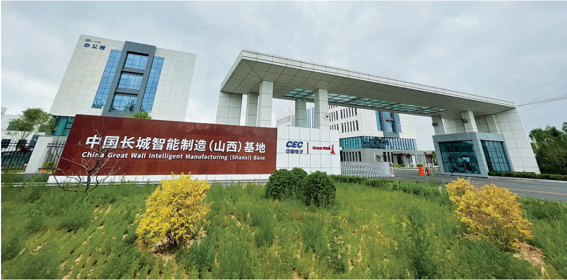
长城智能制造建成投产。

发展壮大新兴产业,改造提升传统产业,战略性新兴产业、高技术制造业对工业增长的贡献率接近40%……太原转型发展提速升级。“百舸争流,奋楫者先。”在全省转型综改和高质量发展征程中,太原一马当先蹚新路。2020年,太原在全省的首位度由“十二五”末的22.5%提高到23.5%。