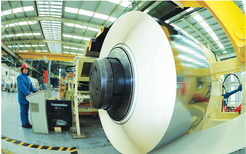
“手撕钢”工艺技术实现新突破,0.015毫米手撕钢问世,“宽幅超薄精密不锈钢带钢工艺技术及系列产品项目”获中国工业大奖。

2018年,我市获批建设国家可持续发展议程创新示范区,针对水污染与大气污染等问题,形成可操作、可复制、可推广的