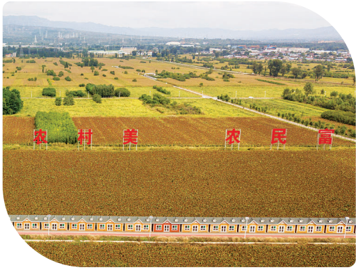
北部现代农业产业园。

自主可控台式机“太行220s”就在这里面世;百度(山西)人工智能基础数据标注产业基地是全国最大的人工智能数据标注产业基地,累计完成数据量全国领先。 本地企业也在迅速成长。在2020深圳湾国际创投大会上,精英数智、智杰软件的人工智能项目从上百个参赛项目中脱颖而出,将深圳湾国际创投邀请赛总决赛的冠军和亚军一起带回太原。 新经济浪潮,数字化时代,浩荡而来。面对新一代信息技术浪潮,太原紧盯科技前沿,紧抓引领未来的技术和项目,奋力抢占制高点。