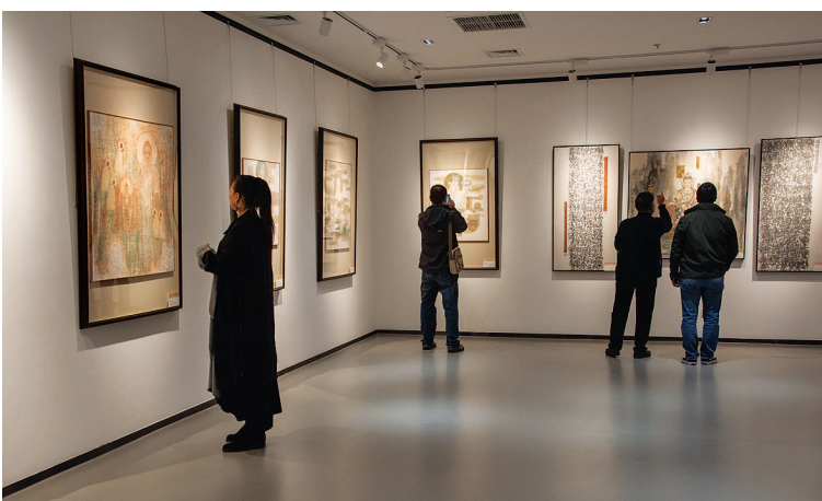
观众在欣赏王春生书画作品。

36岁的C罗每一个进球甚至每一次出场，都是在书写一段新的历史。 北京时间10月10日凌晨，在一场国际热身赛中，葡萄牙以3比0完胜卡塔尔。C罗第36分钟轻松推射入网，这是他国家队生涯的第112个进球，也是他在职业生涯的第791球，两项数据均刷新自己保持的纪录。 不仅如此，C罗国家队生涯攻破46支球队的球门也创造纪录，排名历史第一；而他181次为国家队出场，打破了由拉莫斯保持的欧洲球员国家队出场纪录，还成为第一位自然年国家队进球上双的欧洲球员。 创造众多纪录之后C罗在社交网络发声，“在为国家队出场时一如既往地感到自豪。我们会带着雄心壮志去追逐我们的目标：晋级历史性的2022年世界杯。” 据澎湃新闻