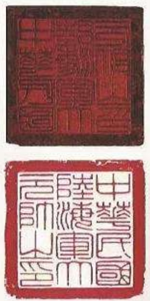
《孙中山——坚定不移、百折不挠的革命家》宋庆龄手稿。 中华民国陆海军大元帅之印。

纪念辛亥革命110周年大会10月9日在北京人民大会堂隆重举行。记者特意走访了位于淮海中路1843号的上海宋庆龄故居，在这里收藏着宋庆龄1966年为纪念孙中山先生诞辰一百周年所作的纪念文章原稿，手稿共51页，这是目前国内保存得最完整且最长的宋庆龄英文手稿之一，是上海宋庆龄故居纪念馆馆藏一级文物，已列入上海市第一批革命文物名录中。 经过保护性修缮的上海宋庆龄故居参观者络绎不绝。这里是中华人民共和国名誉主席宋庆龄从事国务活动的主要场所之一，也是她一生中居住时间最长的地方，是她“可爱的家”。整个院子樟树环绕绿叶蓬勃生长，院子中央的主楼是一幢白色砖木结构的欧式建筑。 故居里藏有宋庆龄相关照片、书信、文稿、国务礼品、生活用品等文物万余件。其中，《孙中山——坚定不移、百折不挠的革命家》手稿是宋庆龄1966年为纪念孙中山先生诞辰一百周年所作的纪念文章原稿，手稿写在全国人民代表大会常务委员会的信笺上。当时用英文写成，后翻译成中文，发表在1966年11月13日的《人民日报》上。 1966年11月12日是孙中山先生诞