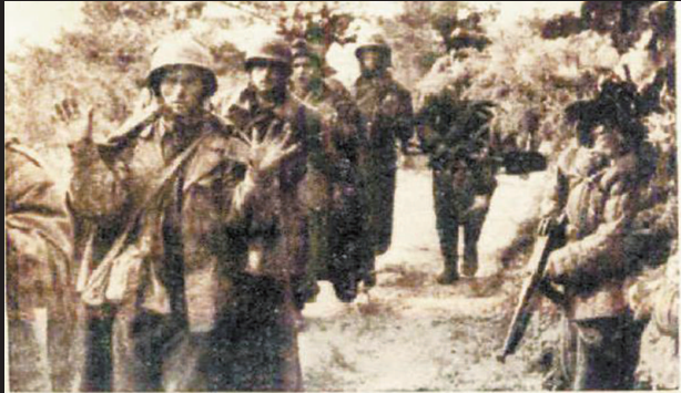
《战斗在长津湖畔》书中插图:美军俘虏惶悚地举着双手。