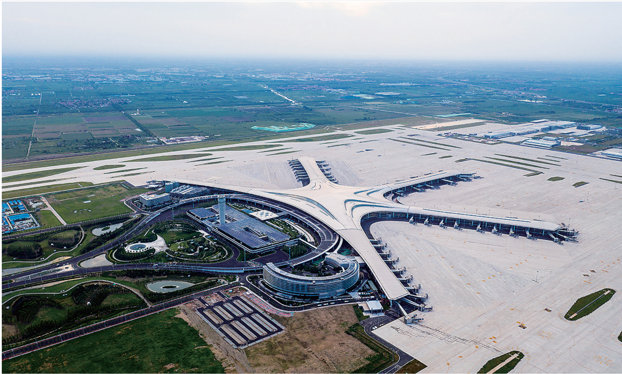
青岛胶东国际机场航站楼采用太钢生产的不锈钢屋面