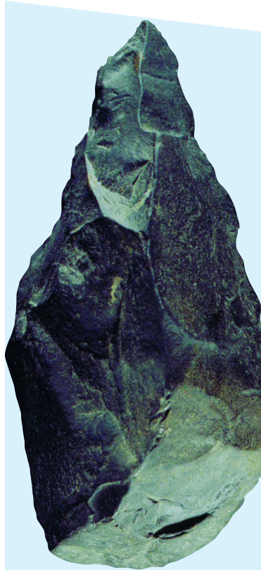
襄汾丁村遗址 大三棱尖状器

发现有铸铜、制骨、制石圭和制陶作坊遗址。发现祭祀遗址11处,其中,侯马盟书即发现于程王路宗庙建筑基址以南。墓地主要有上马墓地、下平望墓地、东高墓地、牛村古城南墓地和柳泉墓地等。其中,柳泉墓地分布面积最大,墓葬规格最高。记者 陈辛华