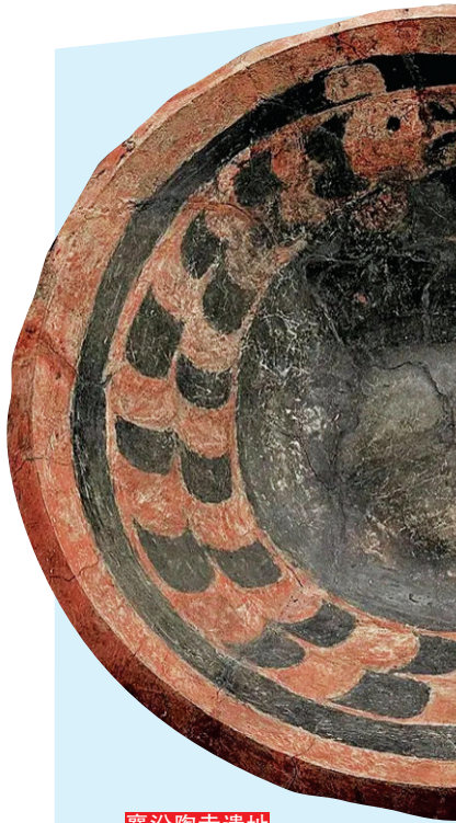
襄汾陶寺遗址 彩陶龙盘