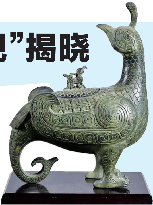
临汾晋侯墓地及曲村一天马遗址 鸟尊

从类型上看,既有聚落、城址、陵寝、墓葬等类型,也有洞穴遗址、矿冶遗址、窑址、沉舰遗址等类型。这些项目反映了中国考古学在人类起源、农业起源、中华文明起源形成和发展、中国早期国家诞生、统一多民族国家形成与发展等重要学术研究的成果,具有重大科学价值和意义、在国内外产生了重大影响、中国考古学发展史上具有重要的地位和作用。