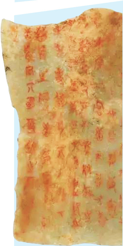
侯马晋国遗址 侯马盟书