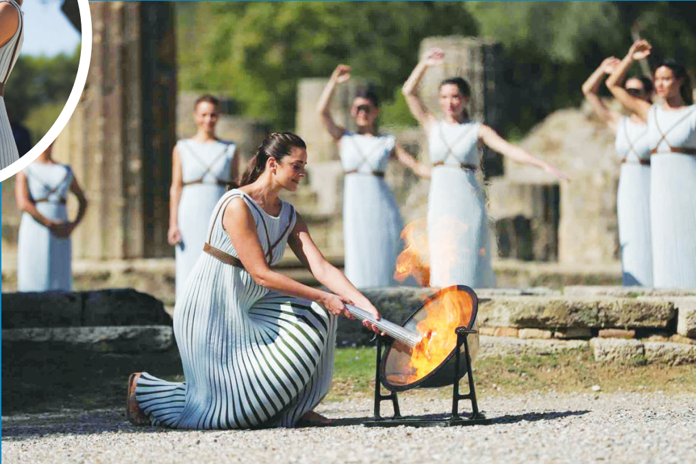
扮演最高女祭司的演员乔治乌取得圣火。

新华社希腊古奥林匹亚10月18日电(记者肖亚卓、于帅帅)18日,北京冬奥会火种在奥林匹克运动发祥地——希腊伯罗奔尼撒半岛的古奥林匹亚遗址采集成功。在有着两千多年历史的赫拉神庙遗址前,奥运火种再次为北京点燃。