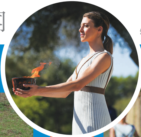
扮演女祭司的演员在火种采集仪式上手捧火种罐。

按照计划,北京冬奥会火种将于当地时间19日在雅典的帕纳辛奈科体育场,由希腊奥委会转交给北京冬奥组委。北京冬奥组委的工作团队将于当天乘坐飞机将火种带回国。