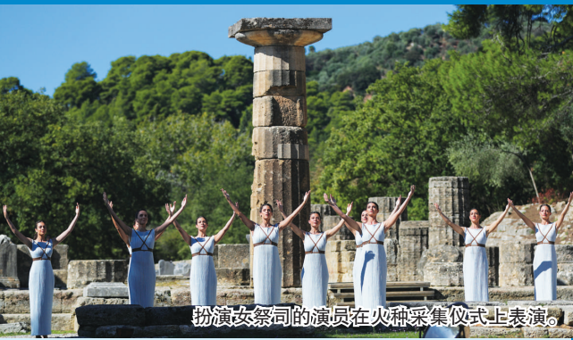
扮演女祭司的演员在火种采集仪式上表演。

当天的所有活动都在严格的疫情防控措施下进行。19日,希腊奥委会将在雅典的帕纳辛奈科体育场把火种转交给北京冬奥组委的代表团。