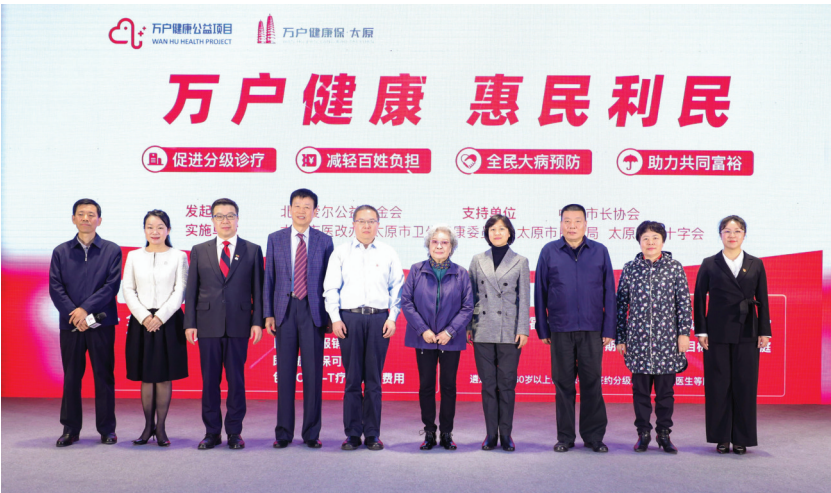
“万户健康”公益项目发布会启动仪式

即日起至2021年12月19日,只要太原市基本医疗参保人(包括城镇职工、城乡居民等)或公费医疗参保人,关注官方参保平台“万户健康保”微信公众号,点击底部菜单栏“参保入口”,即可参保。保障自2021年12月20日正式生效,保障期为1年。