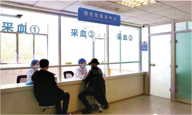
图为山医大一院预住院服务中心。