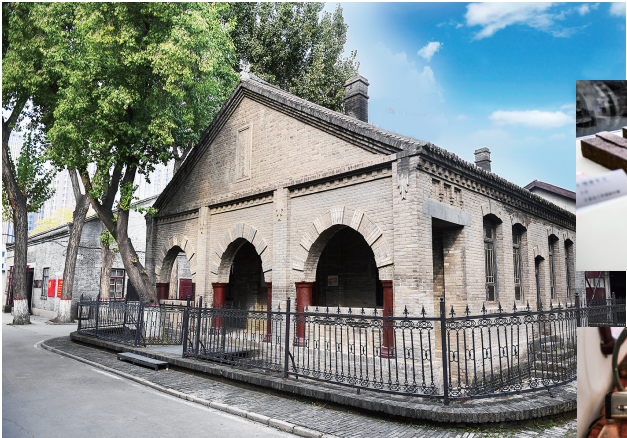
山西机器局办公室旧址