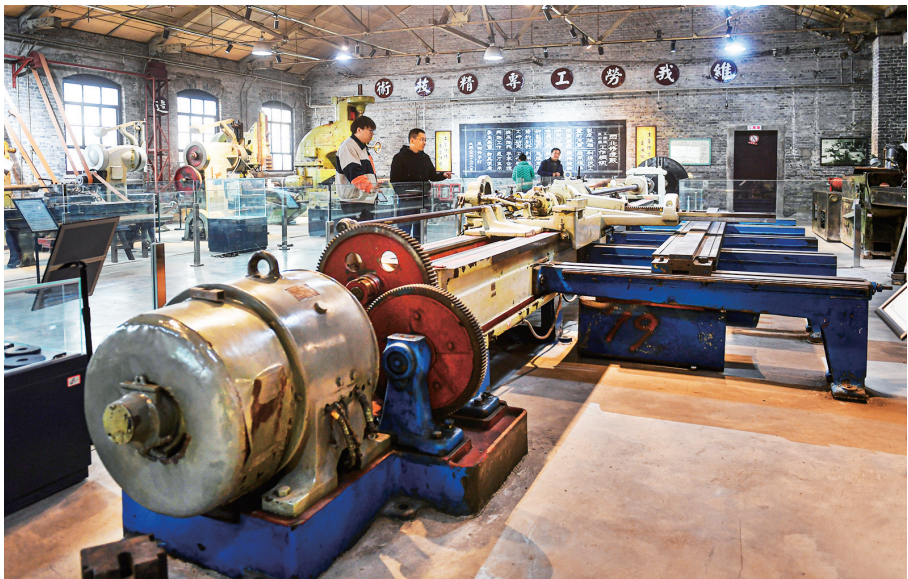
法国索玛公司于上世纪20年代生产的来复线机床