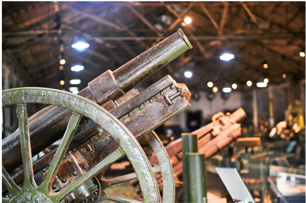
1924年生产的75毫米山炮