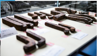
民国时期生产的车刀