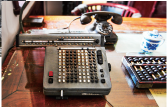
1908年德国生产的手摇计算器