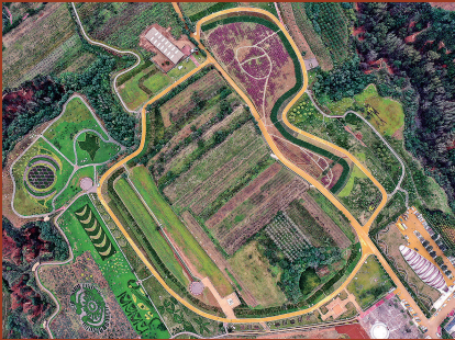
仰韶村国家考古遗址公园。

“100年来，几代考古人筚路蓝缕、不懈努力，取得一系列重大考古发现，展现了中华文明起源、发展脉络、灿烂成就和对世界文明的重大贡献”——习近平总书记在仰韶文化发现和中国现代考古学诞生100周年之际发来的贺信，令全国考古工作者倍感振奋。 百年光阴似箭。一代又一代考古工作者躬身田野、胼手胝足，以扎实的考古资料，在铸就民族血脉的基石上深深镌刻文化自信，令悠久的传承不再是史书中泛黄的记忆，使古老文明在世界舞台上展现绚丽风采。