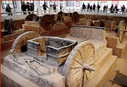
河南安阳殷墟宫殿宗庙遗址内的车马坑。