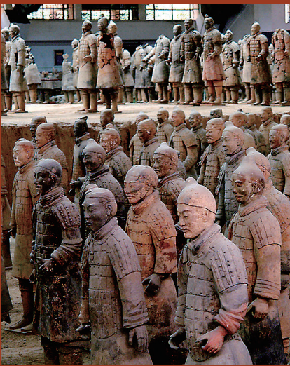
秦始皇兵马俑博物馆一号坑内出土的陶俑。