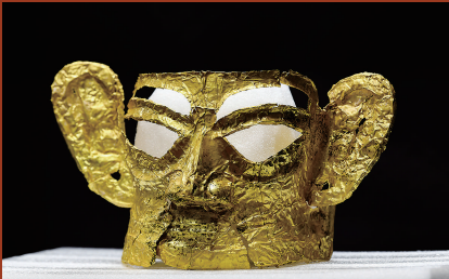
三星堆遗址3号“祭祀坑”出土的金面具。