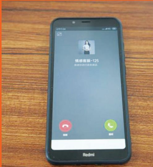
犯罪嫌疑人的微信头像。