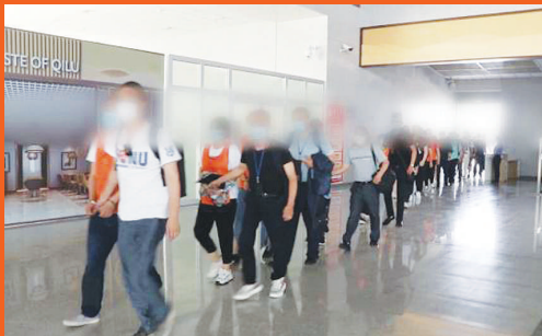
犯罪嫌疑人被带回。

近期,上海、浙江、湖北、广东等多地警方破获打着“情感挽回”幌子的新型诈骗案,骗子们都宣称“百分百挽回”“教你拯救爱情”“三步复合”等,利用被害人挽回情感的急切需求,对照“剧本”话术,实施精心设计的“拯救爱情”骗局。