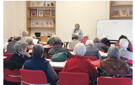
给老年朋友们上课