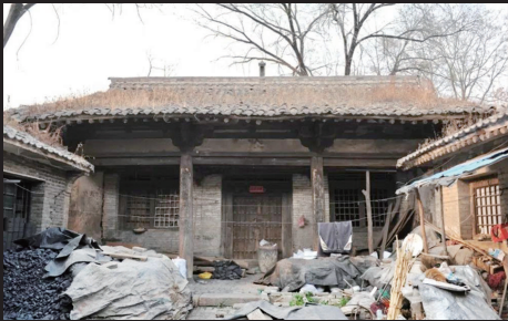
高平南杨村贾氏民居

西窑头村元代姬氏民居为2012年偶然发现,与中庄村第五批国保姬氏民居结构几乎完全一致,檐柱均为抹楞方石柱,心间门板均内退至金柱,门板也为实榻板门,梁架均为长短枋交叠,但斗拱等级更低,为耙头绞项,梁头作爵头造型,这两座元代民居相距不远,但西窑头姬氏民居目前保级仅为高平市不可移动文物,现民居内还居住着两位70多岁的老人,老人也姓姬。