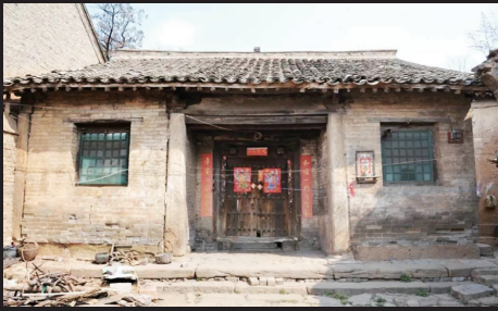
高平西窑头村元代姬氏民居

头作爵头造型,正房与西厢房采用的是驼峰抬梁,东厢房采用的是蜀柱合脊抬梁,略有区别,但都属于较早的做法,且平梁以上叉手、丁华抹额拱、蜀柱合脊做法基本一致,可认为是同时期建筑。 下圪坨院三座建筑均为四架通檐用两柱,结构较中庄村姬氏民居和西窑头姬氏民居为简单,单个体积也较小,胜在三座构成国内唯一的,近乎完整的元代民居院落,是非常珍贵的元代民居合院实物。