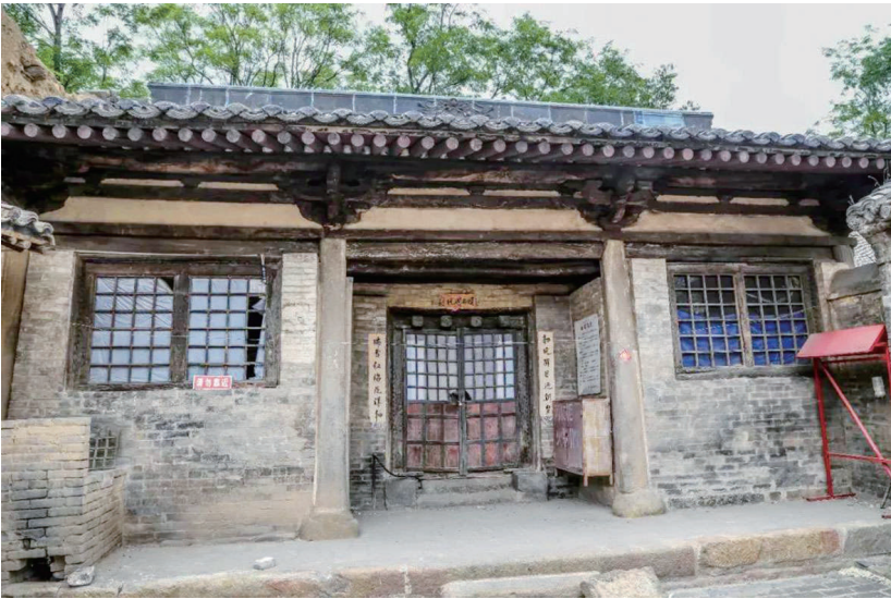
高平中庄村元代姬氏民居

中庄村姬氏民居建于元代至元三十一年(1294年),姬氏民居发现于山西省第二次文物普查,发现时仅正房为元代建筑,建筑面目苍苍,整体给人以简洁稳重之感。 姬氏民居的年代依据除了建筑结构类型外,最直接的证据为正房房门门砧石上的题记:“大元国至元三十一年岁次甲午仲□□□姬宅置□石匠天党郡冯□□冯□□”,“□”被门槛遮挡的文字,比较有趣的是这处题记本应被门槛完全遮挡,但由于主人在此处开了一个供猫咪进出的“猫