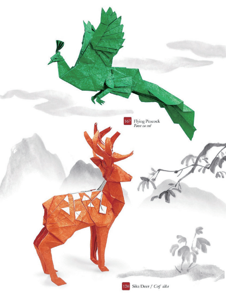
个人折纸作品集《ORIGAMI MOMENTS》在法国出版