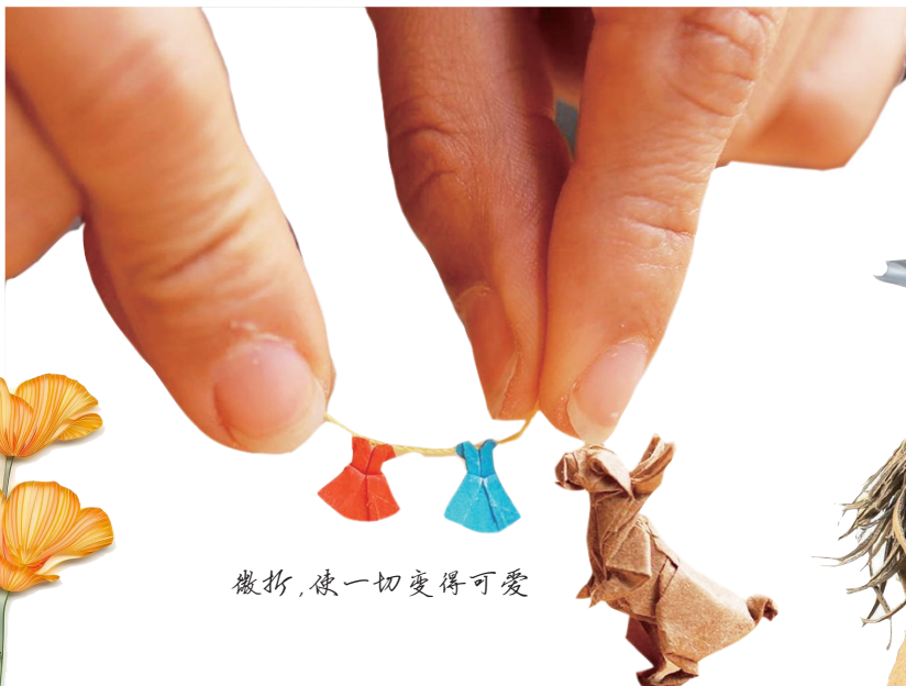
微折，使一切变得可爱