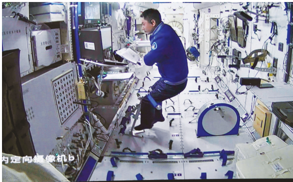
叶光富在核心舱内工作场景。

新华社北京11月7日电(记者王逸涛、郭中正)据中国载人航天工程办公室消息，北京时间2021年11月7日18时51分，航天员翟志刚成功开启天和核心舱节点舱出舱舱门，截至20时28分，航天员翟志刚、王亚平身