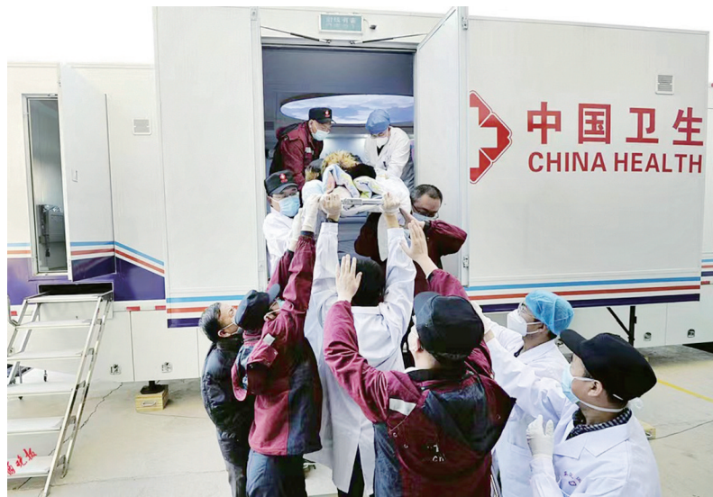
医务人员将一名昏迷患者抬下医疗队带来的移动“方舱”CT。

据介绍,国家紧急医学救援队(山西)成员都是经验丰富的“老兵”,2020年初出现新冠肺炎疫情之后,他们在驰援武汉的53天里,承担了3个方舱医院患者的救治。此次院方派出包括内、外、妇、儿、产科在内的95名医护人员,14台应急处置车,还携带救治和手术所需药品器械,检验检测、放射检查(移动CT)相关设备及用品,消毒灭菌设备以及医务人员个人防护用品。目前,救援队筹建开展大内科、大外科、妇产和儿科工作,同时建设包含院前急救功能的急诊科和手术室,并根据疫情防控要求,规划场地、因地制宜,利用功能帐篷与医院原有建筑相结合设置医患通道、核酸采集区。在承担当地群众日常医疗服务的基础上,也向当地医生分享宝贵经验,为当地打造一支技术好、能力强、带不走的急诊队伍。