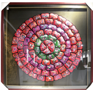
《百鸟朝凤》堆锦刺绣