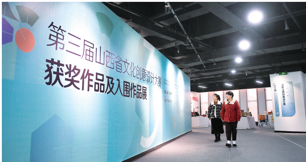
第三届山西省文化创意设计大赛获奖作品及入围作品展展厅