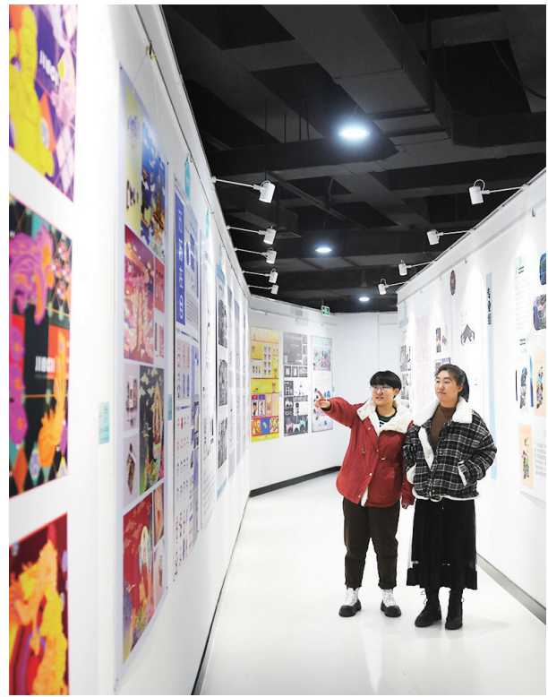
视觉传达创意设计展示