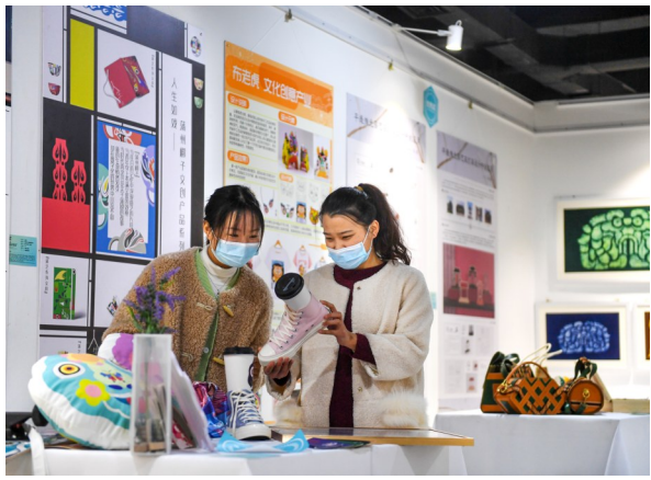
文化文博创意设计展示