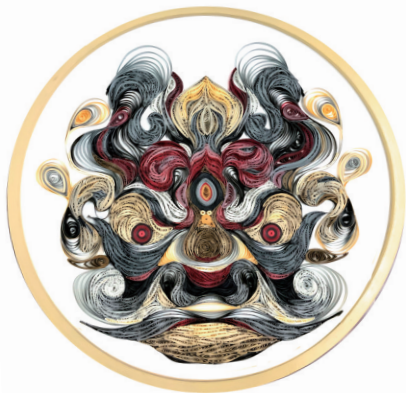
醒世兽纹衍纸作品