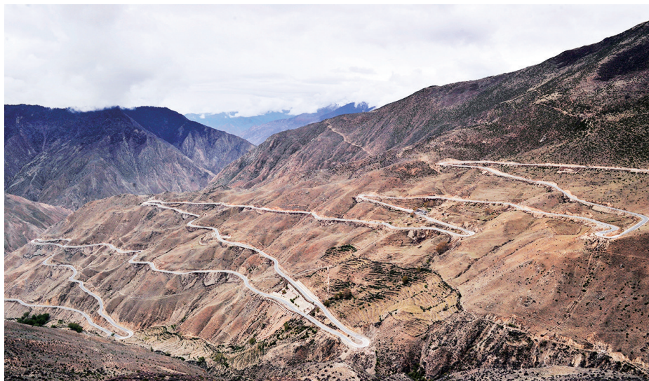
这是川藏公路西藏昌都市境内的“怒江七拐”(2016年5月15日摄)。

新形势下,我们要继续弘扬“两路”精神,养好两路,保障畅通,使川藏、青藏公路始终成为民族团结之路、西藏文明进步之路、西藏各族同胞共同富裕之路。