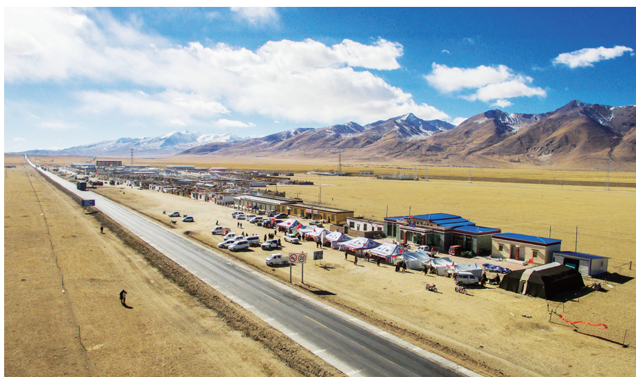
这是在青藏公路旁搭建的那曲县香茂乡畜产品展销会(2017年11月25日摄,无人机照片)。