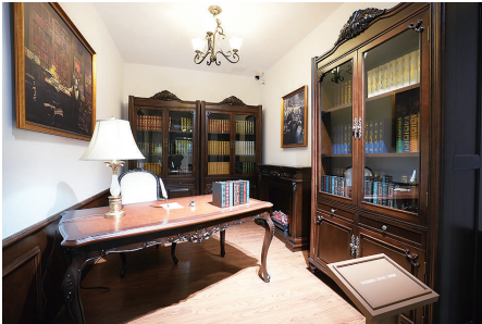
马克思撰写《资本论》的还原场景。

“马克思主义中国化的光辉历程”专题展览，重点展示中国共产党创造性地运用和发展马克思主义，形成了毛泽东思想、邓小平理论、“三个代表”重要思想、科学发展观、习近平新时代中国特色社会主义思想，这些马克思主义中国化的理论成果为中国革命、建设、改革提供了强大思想武器，指引中国共产党带领全体中华儿女不断奋进，凝聚起实现中华民族伟大复兴的磅礴力量。