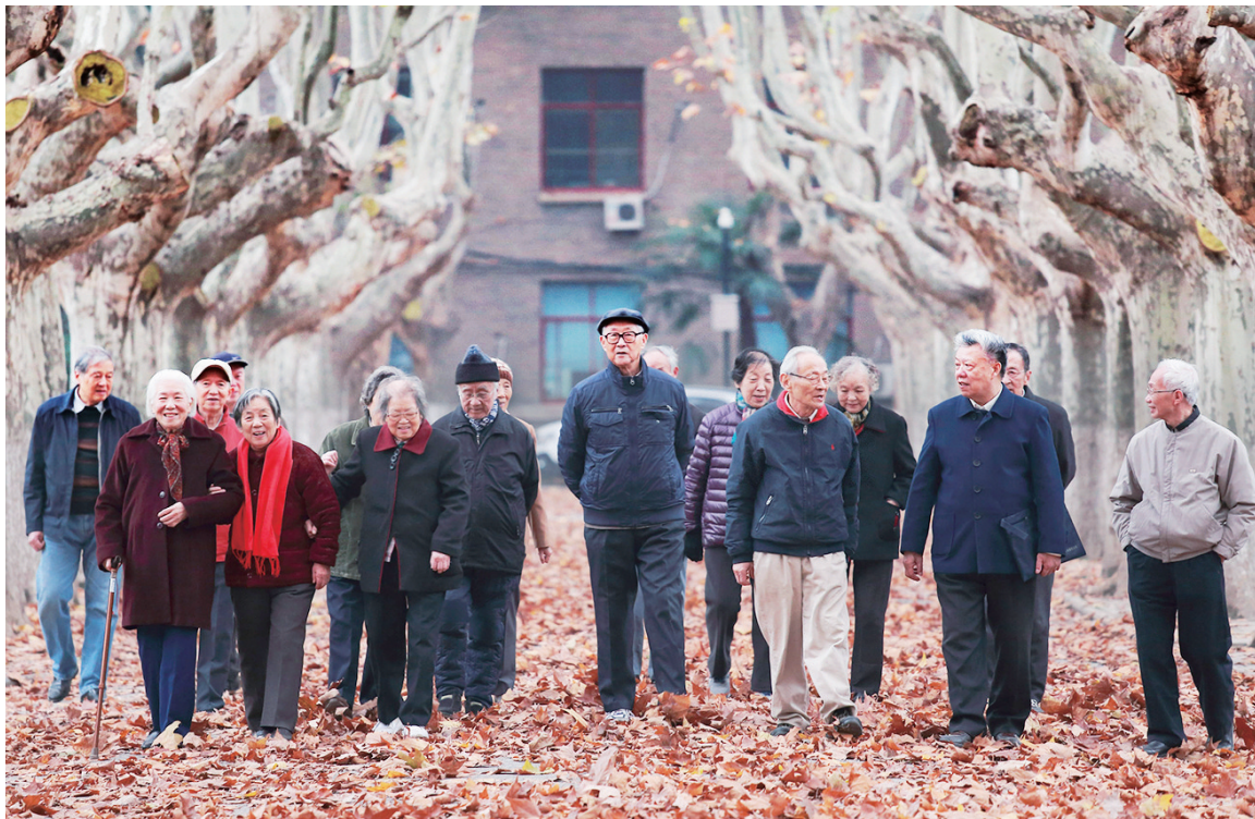
西安交通大学“西迁人”爱国奋斗先进群体。

西迁精神是中国共产党人精神谱系中知识分子群体爱国奋斗的时代坐标。这一精神力量,激励着一代代知识分子忠于祖国人民、担当责任使命,书写新的时代答卷。