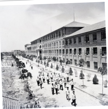
1959年拍摄的西迁后的交通大学校园一景(资料照片)。