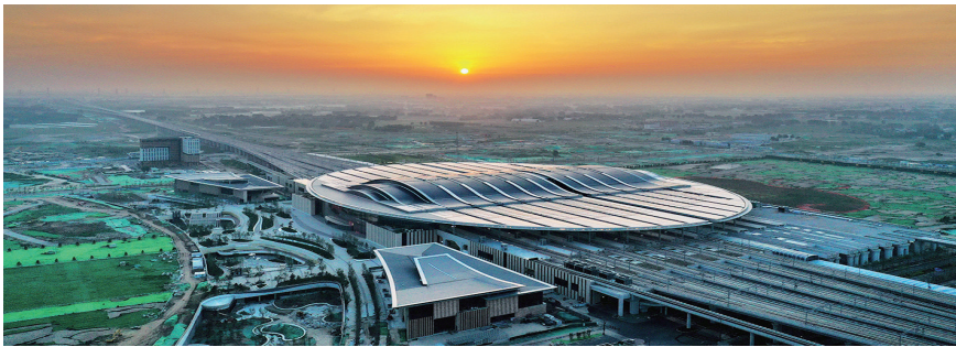
右图:京雄城际铁路雄安站(2021年7月1日摄,无人机照片)。