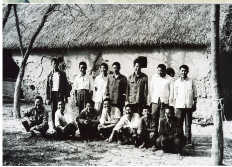
上图:1978年冬,18位农民按下红手印的“大包干”契约(资料照片);