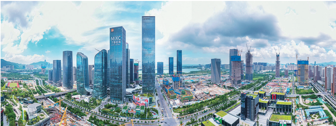
上图:深圳前海深港现代服务业合作区(2021年9月8日摄,无人机全景照片)。

习近平总书记深刻指出:改革开放铸就的伟大改革开放精神,极大丰富了民族精神内涵,成为当代中国人民最鲜明的精神标识!