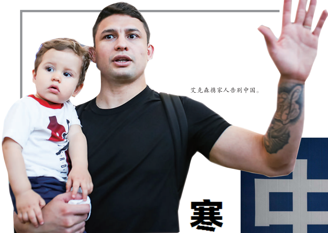
艾克森携家人告别中国。