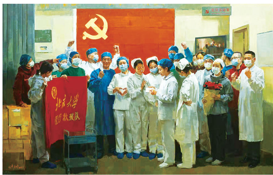
油画《总书记的回信》 何红舟 郭大勇作