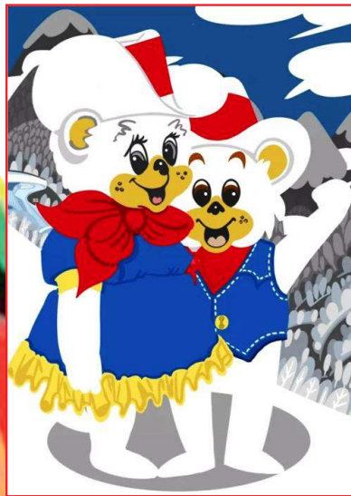
1988年 卡尔加里冬奥会

卡尔加里冬奥会吉祥物是一对拟人化的北极熊兄妹,它们戴的红白帽子,是加拿大国旗的颜色。这对北极熊兄妹开创了奥运会(包括夏奥会和冬奥会)历史上使用超过一个吉祥物的先河,同时吉祥物有了性别之分。