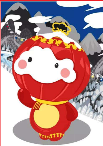
北京2022年冬残奥会吉祥物“雪容融”

北京2022年冬奥会即将在我们“家门口”举办。大家早已认识了可爱的熊猫“冰墩墩”,以及源于灯笼造型的“雪容融”。很多人都认为它俩就是本届冬奥会的吉祥物。但你知道吗?其实“冰墩墩”是北京冬奥会的吉祥物,“雪容融”则是北京冬残奥会的吉祥物。