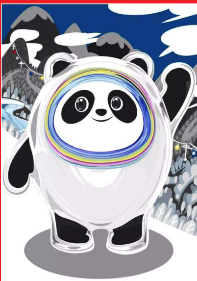
北京2022年冬奥会吉祥物“冰墩墩”