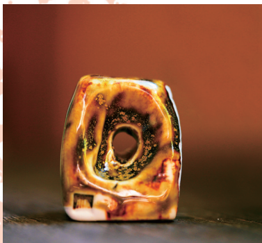
黑缸釉·乌金山陶泥印