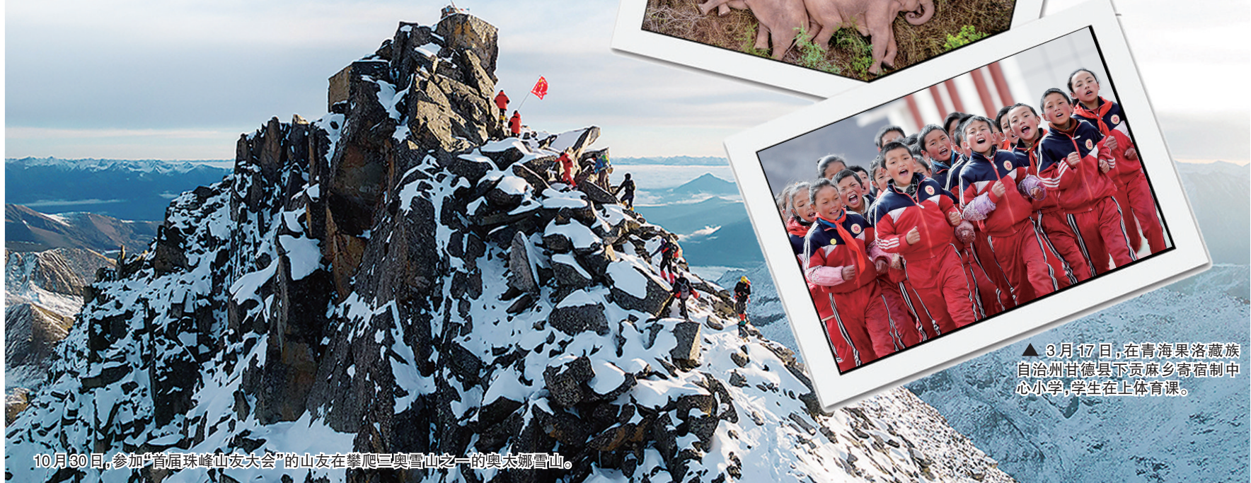
10月30日,参加“首届珠峰山友大会”的山友在攀登三奥雪山之一的奥太娜雪山。