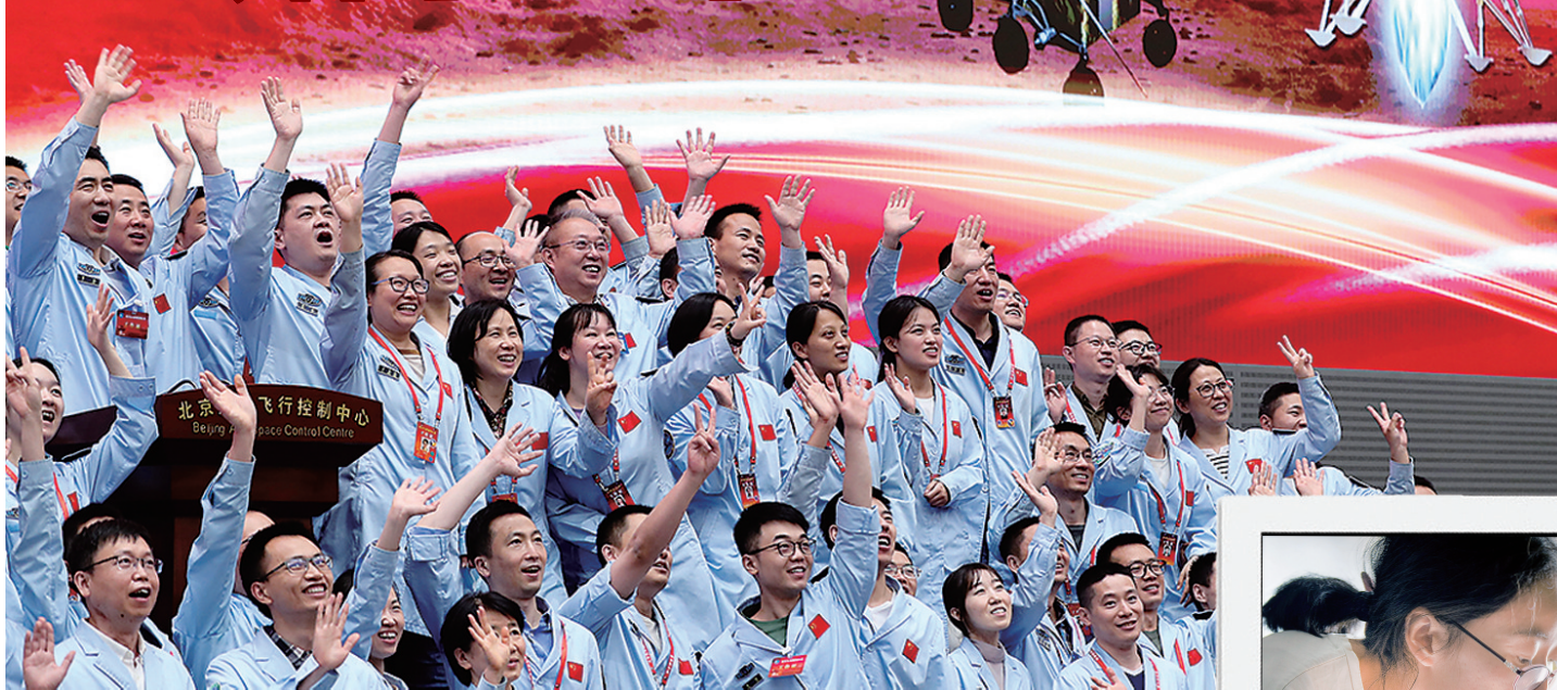
5月15日,航天科研人员在航天飞行控制中心指挥大厅庆祝我国首次火星探测任务着陆火星成功。