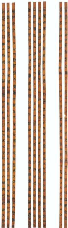
清华简《五纪》竹简图版。

简的形制多种多样,最长的46厘米,最短的10厘米左右。简上的墨书文字出于不同书手,风格不尽一致,大多精整清晰。有少数简上还有红色的格线,即所谓“朱丝栏”。