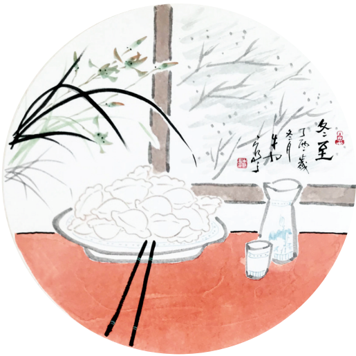
冬至 牛力 绘

在男人“拉太阳”的同时,没有资格参加的女人在家里忙着包饺子,火盆里的火烧旺以后,饺子也可以出锅了。照例第一碗盛起来,放到祖先的牌位前,既表达孝心,更有让祖先保佑全家平安的意思。直到此时,才可以把那盏灯收起来,待得来年冬至再用。现在,随着社会的发展,油灯也早已绝迹,屋里有了暖气,也不会再生明旺旺的火盆了,只有包饺子祭祖的习俗还在不少地方得以保存。