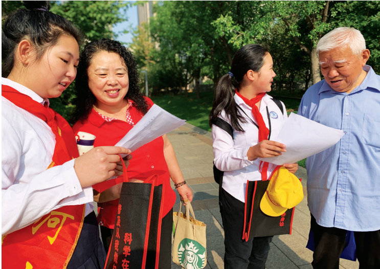
劲松新景小区内,老少同乐,宛如一家人。

“可不是吗,关键时刻,总有咱物业及时顶上!一天早上,我突然接到电话,说父亲心脏不舒服。我打完120,又打电话