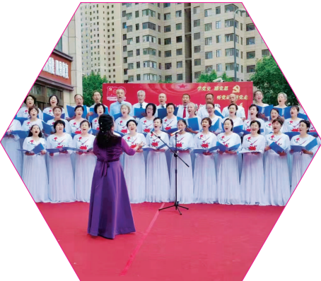
图为阳光汾河湾社区文化活动中心合唱团。

12月21日,走进刚刚获评为太原市“文明小区”的晋源区阳光汾河湾小区的养老中心,工作人员、老人们正欢聚在一起包饺子过冬,阳光汾河湾社区文化活动中心的队员们还为大家带来了精彩纷呈的文艺表演,歌声笑声连成一片,每个人的心里都是满满的幸福。