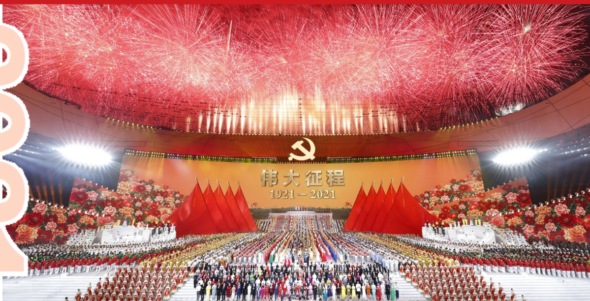
《伟大征程》演出现场。