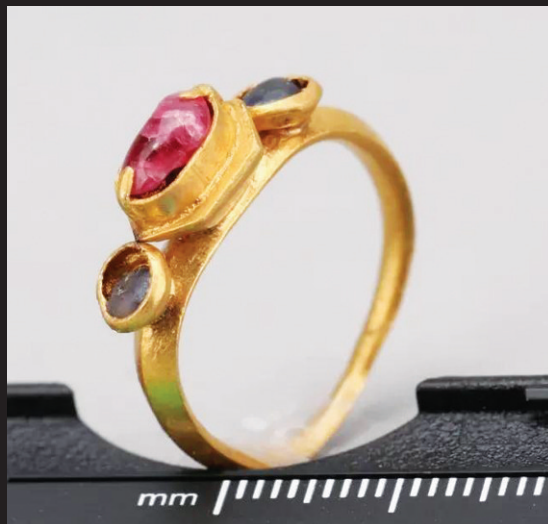
M2出土的嵌宝石金戒指