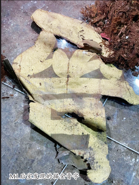
M1后室发现的描金晋字