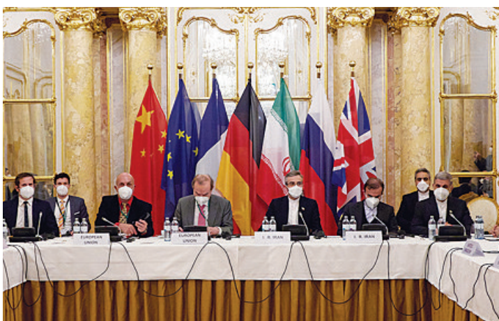
这是12月27日在奥地利维也纳拍摄的伊朗核问题全面协议联合委员会政治总司长级会议现场。

努力扩大共识。同时,要妥善处理分歧。在伊核及相关防扩散问题上,不能出于一己私利,搞实用主义和双重标准;也不能动辄威胁制裁,甚至在