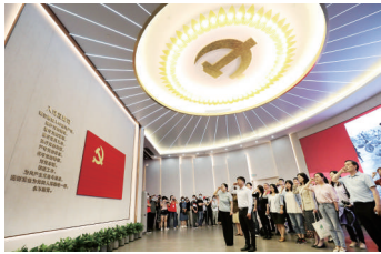
2021年6月3日，党员在全新开放的上海中共一大纪念馆里重温入党誓词。