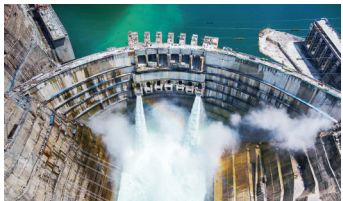
2021年6月10日拍摄的金沙江白鹤滩水电站。白鹤滩水电站是实施“西电东送”的国家重大工程，是当今世界在建规模最大、技术难度最高的水电工程（无人机照片）。