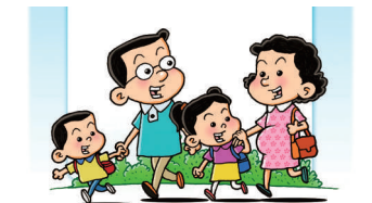
7月20日，三孩生育政策发布实施。