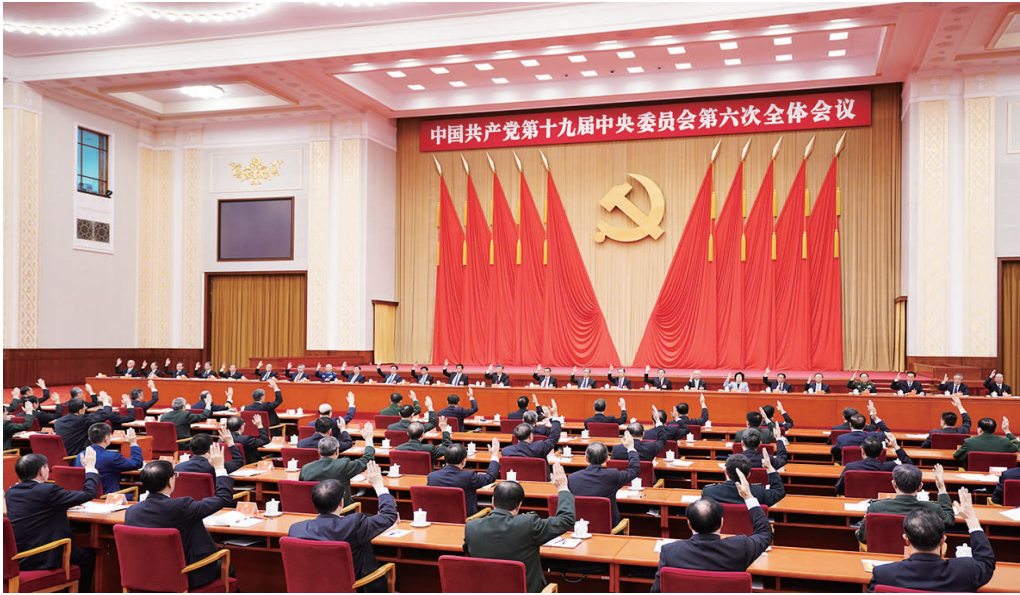
这是11月8日至11日中国共产党第十九届中央委员会第六次全体会议现场。