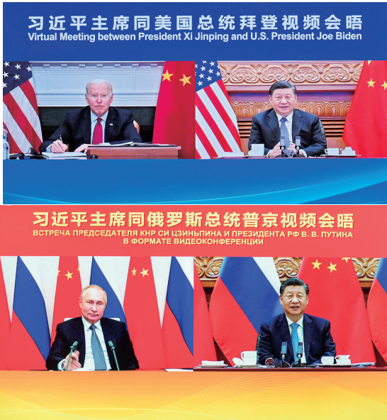
2021年11月16日上午，国家主席习近平在北京同美国总统拜登举行视频会晤。