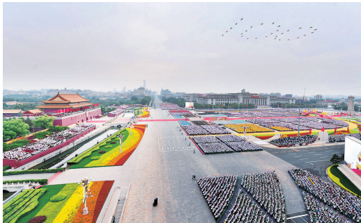
2021年7月1日上午，庆祝中国共产党成立100周年大会在北京天安门广场隆重举行。这是飞行庆祝表演。