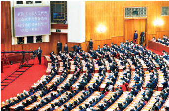
2021年3月11日，十三届全国人大四次会议表决通过《全国人民代表大会关于完善香港特别行政区选举制度的决定》。这是表决现场。