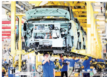
2021年8月12日，在广西柳州一家汽车企业，工人在新能源汽车生产线上忙碌。

新华社北京12月29日电 新华社评出2021年国内十大新闻（按事件发生时间先后为序）