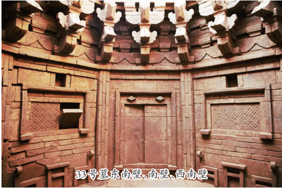
33号墓东南壁、南壁、西南壁