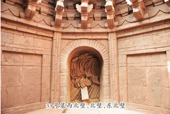
33号墓西北壁、北壁、东北壁