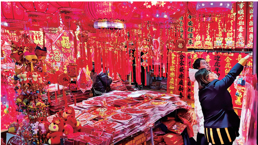
12月30日,双塔西街一商场内,对联、红灯笼等节日用品营造出浓浓的新年氛围。