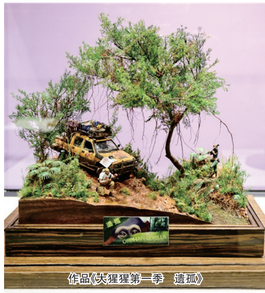
作品《大猩猩第一季 遗孤》